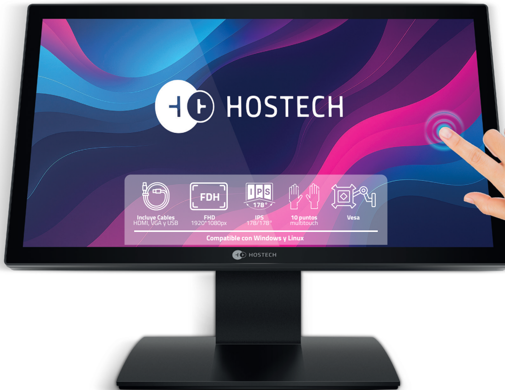
Imagen solo para fines ilustrativos / Image for illustrative purposes only